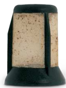
Préfiltre de la E3T – obstrué par la rouille

La plupart des pompes à carburant modernes sont irriguées, donc lubrifiées et refroidies, par le carburant. Si cette irrigation est insuffisante, par exemple suite à l'encrassement, une « marche à sec » risque de se produire. Les pompes à carburant des séries E1F, E2T et E3T possèdent un préfiltre incorporé côté aspiration. Ce petit préfiltre est une protection contre les impuretés. Il peut être obstrué par la crasse présente dans le carburant aspiré.