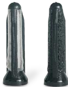
Préfiltre de la E1F : neuf à gauche, obstrué à droite